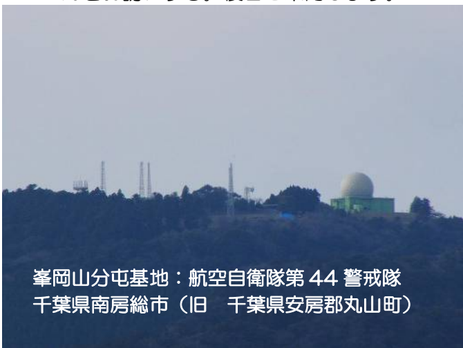
峯岡山分屯基地：航空自衛隊第44警戒隊 千葉県南房総市（旧 千葉県安房郡丸山町）