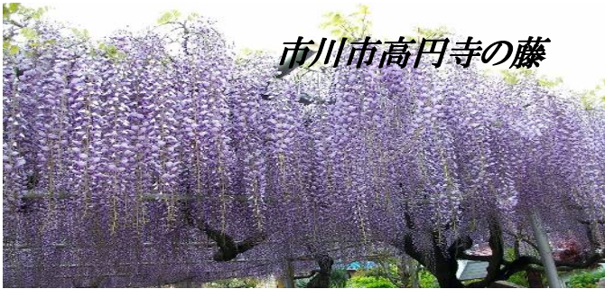
市川市高円寺の藤