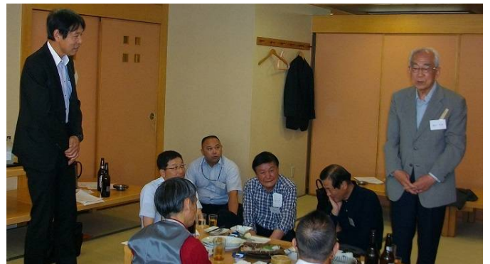
最高齢・櫻井会員（83歳）のスピーチ（右）