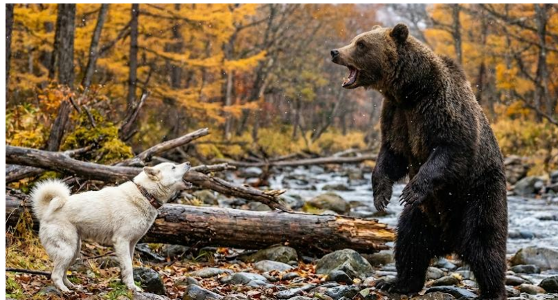
熊に対峙する北海道犬(イメージ)