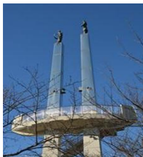
太田山公園 「きみさらずタワー」