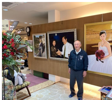
肖像画工房「アトリエ美yosi」 鴨川駅前「アルソワビル」