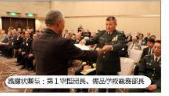
感謝状贈呈：第1空挺団長、常盤学校総務部長