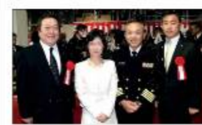
岡田清一衆議院議員(左) 箱崎航空補給処長夫妻(中央) 渡邊芳邦本郷市長(右)

4月4日(土)観桜会が開催された。箱崎航空補給処長の挨拶に続き、本郷自衛隊協力会顧問岡田清一衆議院議員、同自衛隊協力会会長渡邊芳邦