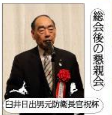
白井日出男元防衛長官祝辞