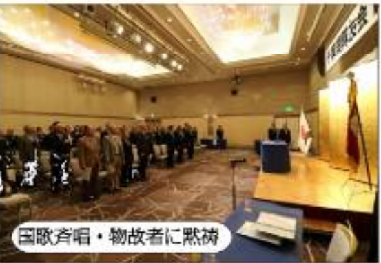
国歌斉唱・物故者に黙祷