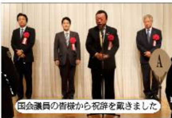
国会議員の皆様から祝辞を戴きました