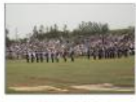
高等工科学校生徒ドリル