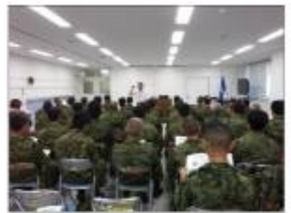
予備自衛官48名に対し講話