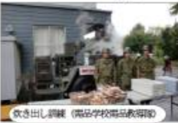
炊き出し訓練 (高品学校備品教研室)