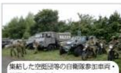
集結した空挺団等の自衛隊参加車両・偵察オートバイ