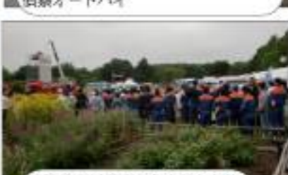
消防等関係機関から多数が研修

県・市のほか自衛隊、警察、消防機関、医療関係団体、ボランティア団体、ライフライン事業者等89機関、5千人が参加、救出救助訓練、医療救護訓練、ライフライン応急復旧訓練、救援物資搬送等訓練、炊き出し訓練、防災フェア等が行われた。自衛隊から第1空挺団、高射学校及び高品学校が参加した。【事務局】