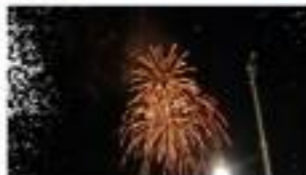
今年は松戸も花火が上がりました。