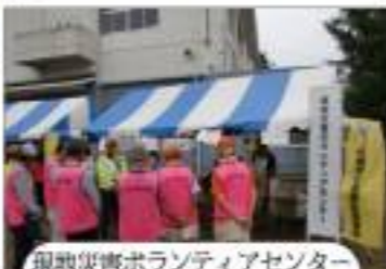
現地災害ボランティアセンター 佐倉市社会福祉協議会が運営