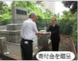
倉田寛之元参議院議長追悼の葬