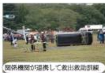
関係機関が連携して救出救助訓練