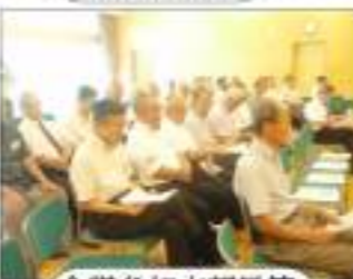
会議参加支部長等

◆退職予定隊員への説明・勧誘 ◇入会促進会員等(居住支部長等)が実施 ◇入会促進活動を実施する場合は、その都度、必ず調整先担当者に通報する。