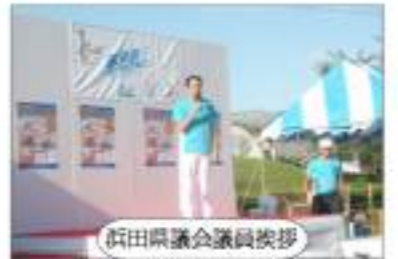
浜田県議会議員挨拶