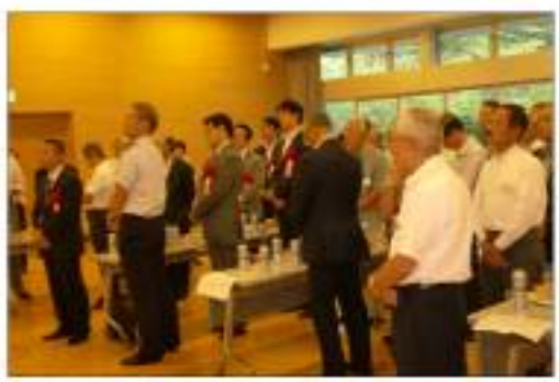
講演会終了後、講師、来賓の方々を交え、缶ビールを片手に懇親