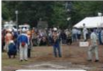
森田千葉県知事 講評