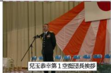
兒玉恭幸第1空挺団長挨拶