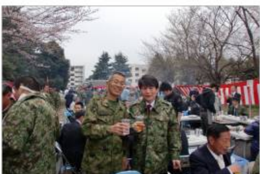
清水聖士鎌ヶ谷市長も隊員と乾杯 (松戸)