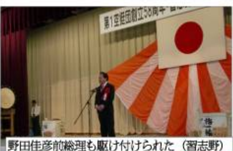
野田佳彦前総理も駆け付けられた (習志野)