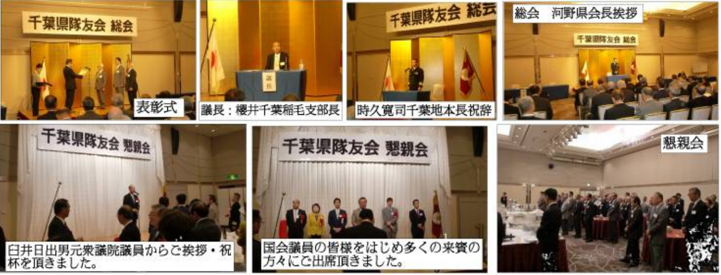
総会 河野県会長挨拶

◆平成28年度前期支部長等会議 7月20日(水) 13時30分から千葉市民会館で開催します。参加者＝県役員及び支部長