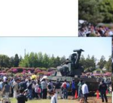
多くの人で賑わう下志津駐屯地