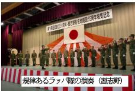
規律あるラッパ隊の演奏 (習志野)