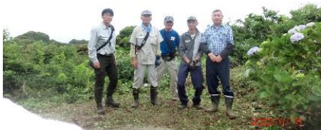
お疲れさまでした（6/18）