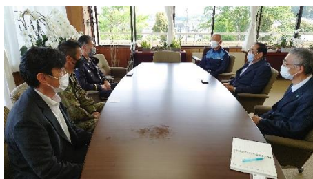
いすみ市庁舎での会議(5/10)

千葉県隊友会夷隅支部は、毎年災害発生はいつ、突然起こるかわかりませんので日頃（年1回程）から、担当区域自治体首長（副市長、危機管理官）と、災害発生時の担当自衛隊区長と面談、意思疎通を諮る事を目的とした会議を5月10日（火）実施しました。