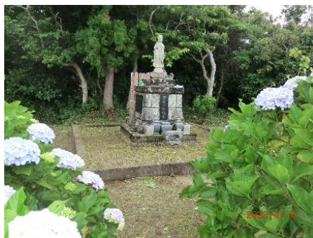
大変綺麗になりました。

度から、再入会推進と一般から、隊員家族、防衛、防災に関心のある方から「特別会員」を募る決議（細部は裏面に）し、特別会員10名募集開始することになりました。午後からは、勝浦市に移動「沖風」平和観音像周辺の清掃草刈り作業5名で実施しました。